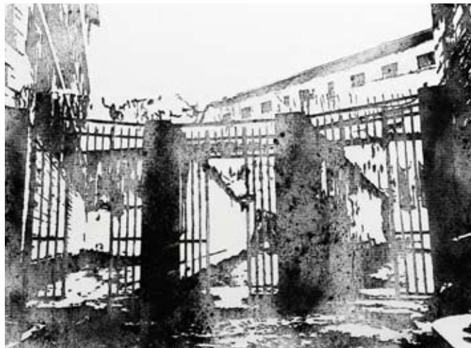
“Saint Paul entrée des cours disciplinaires” 2013 Poudre d’acier aimantée, 70x130 cm

J’investis des questions essentielles : la vie, la mort, la condition humaine et les formes sociales qui les façonnent. Dans mes derniers travaux, la vitesse, la fragilité, la porosité, l’aspect fantomatique des images et des matières, transmettent la pression du passé au croisement de ce qui va advenir. Mon travail s’inscrit dans la durée, il dessine un chemin. De mes premières réalisations à celles d’aujourd’hui une évolution certaine s’est formée, une trajectoire qui tend vers la recherche de la liberté, du dégagement de la contrainte. Je tâche d’expérimenter l’intensité et la rigueur, je joue avec le danger, mental, visuel, physique, pour renforcer l’énergie créatrice et en transmettre la force. Je suis conduit par mon histoire, mes propres questions existentielles et par le choix d’une adéquation permanente et subtile entre forme et contenu