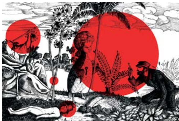
L'art & la science. 2013. 50x65 cm Estampe numérique d'après un dessin à l'encre www.venusdailleurs.fr

Né en 1977 à St Avold (moselle) vit et travaille à Gajan (30)