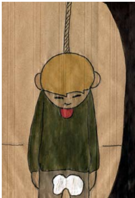
Sans Titre 2009 de la série Shaman Kafka Conspiracy les Poèmes d'un épicier analphabète Graphite et encres sur pochette de papier kraft 21x14 cm