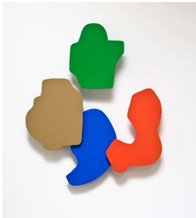
Sans Titre , 2013 Acrylique sur bois, 70x50x7 cm

Didier Béquillard voyage, observe, s'observe, pour définir plastiquement l'humain par ce dont il s'entoure, se protège, ces formes qu'il crée et qui le moulent, ces chemins qu'il trace et qui l'orientent, souvent le dirigent. Architecture et urbanisme comme objets d'étude, paléontologie appliquée aux espaces humains, coquilles délaissées d'un étrange escargot dont la bave, fossilisée, à tracé routes, réseaux, maillages, trames. Voilà l'objet.