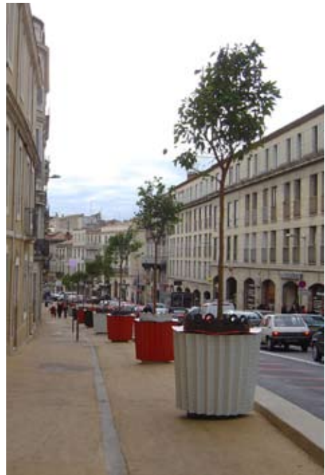
“Big Bac”, 2006 Montpellier, boulevard du Jeu de Paume