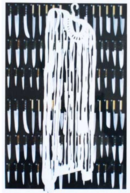
Gilet, 2012 Papier blanc découpé, impression jet d'encre 26x19 cm

Avec le papier qui est longtemps demeuré sa matière de prédilection, Ghislaine Portalis a développé une grande variété d'œuvres dont les intentions étaient avant tout formelles. Depuis 1997 de façon discrète la narration s'est introduite dans ses productions qui subrepticement sont devenues des propositions.