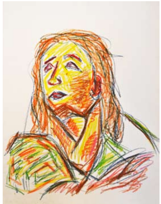
Sans titre, d'après Titien 2013 pastel sur carton toilé 65x50 cm