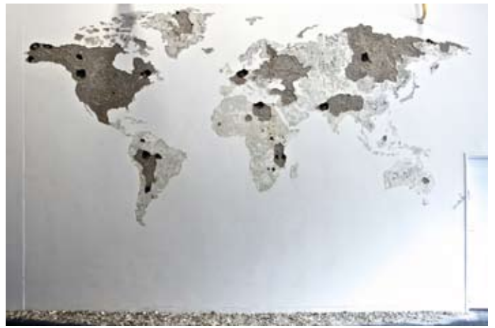
Mappemonde, 2009 Impacts de marteau sur mur, 7x4 mètres Centre d'Art Contemporain Mains d'Oeuvres, Paris

Le travail de Jean Denant interroge l'humain à partir de l'architecture. Considérant que celle-ci modèle le monde dans lequel les êtres évoluent, c'est par le prisme du geste créatif que l'artiste interroge la nature humaine. L'architecture est une proposition contemporaine pour traiter du réel, pour essayer de l'appréhender et ainsi orienter le monde. Mais, dans les œuvres de Jean Denant, l'architecture, c'est bien plus, c'est une métaphore poétique et philosophique pour parler de l'état du monde. Bâtiment ou histoire humaine, tout est affaire de construction. C'est ainsi à une tentative de construction-déconstruction que nous convie l'artiste.