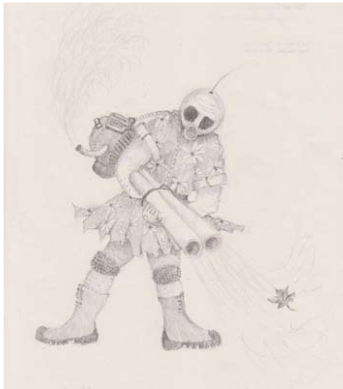
Gilles Clément Le jardinier 2002 crayon sur papier format A4

Edition: « Les imprévisibles », 110 pages, édition Sens et Tonka, octobre 2013